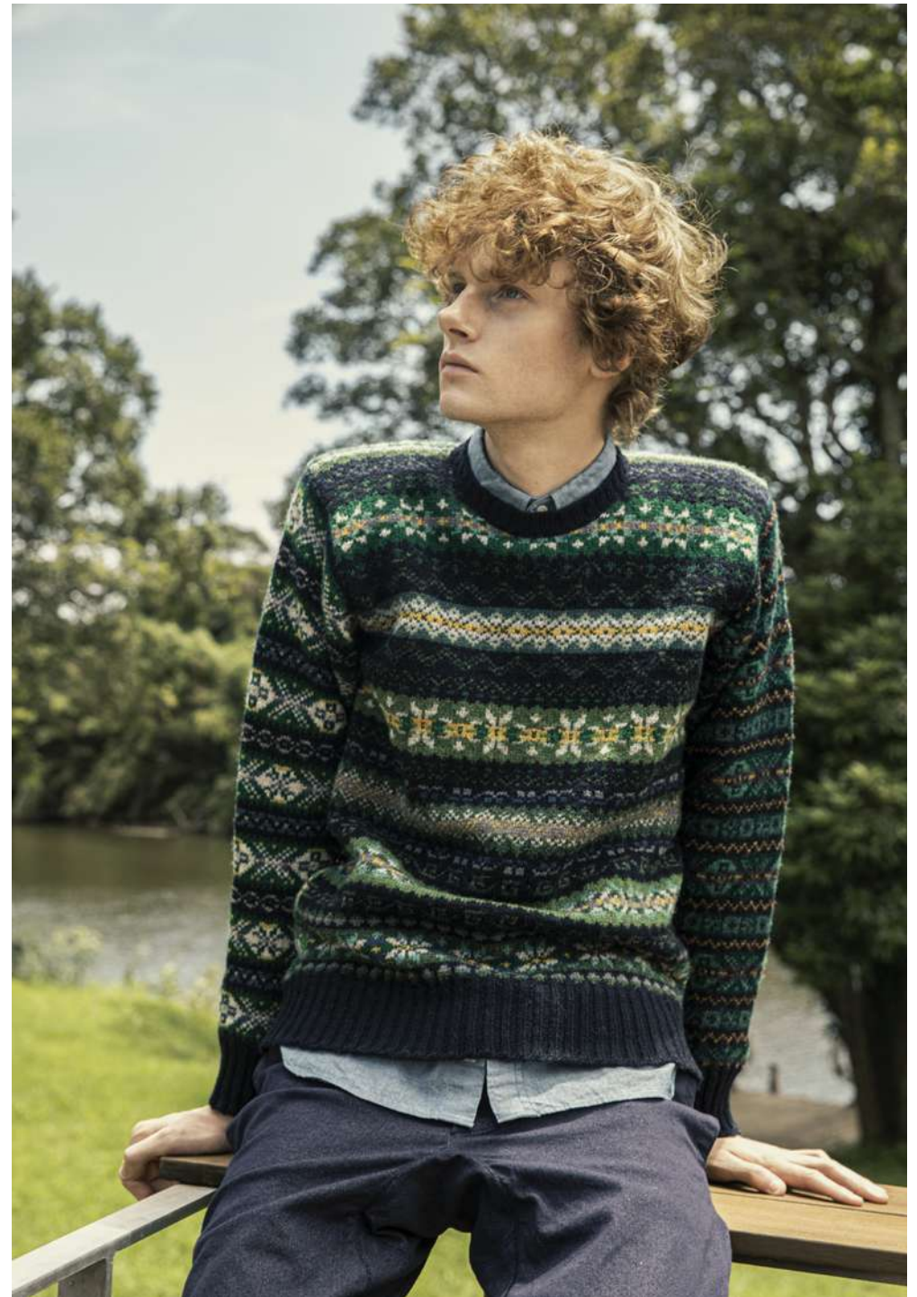
BEAMS ニット (ジャミーソンス×ビームス プラス) ¥31,000 シャツ ¥12,500 パンツ ¥12,000 (ともにビームス プラス) *表示価格はすべて税別