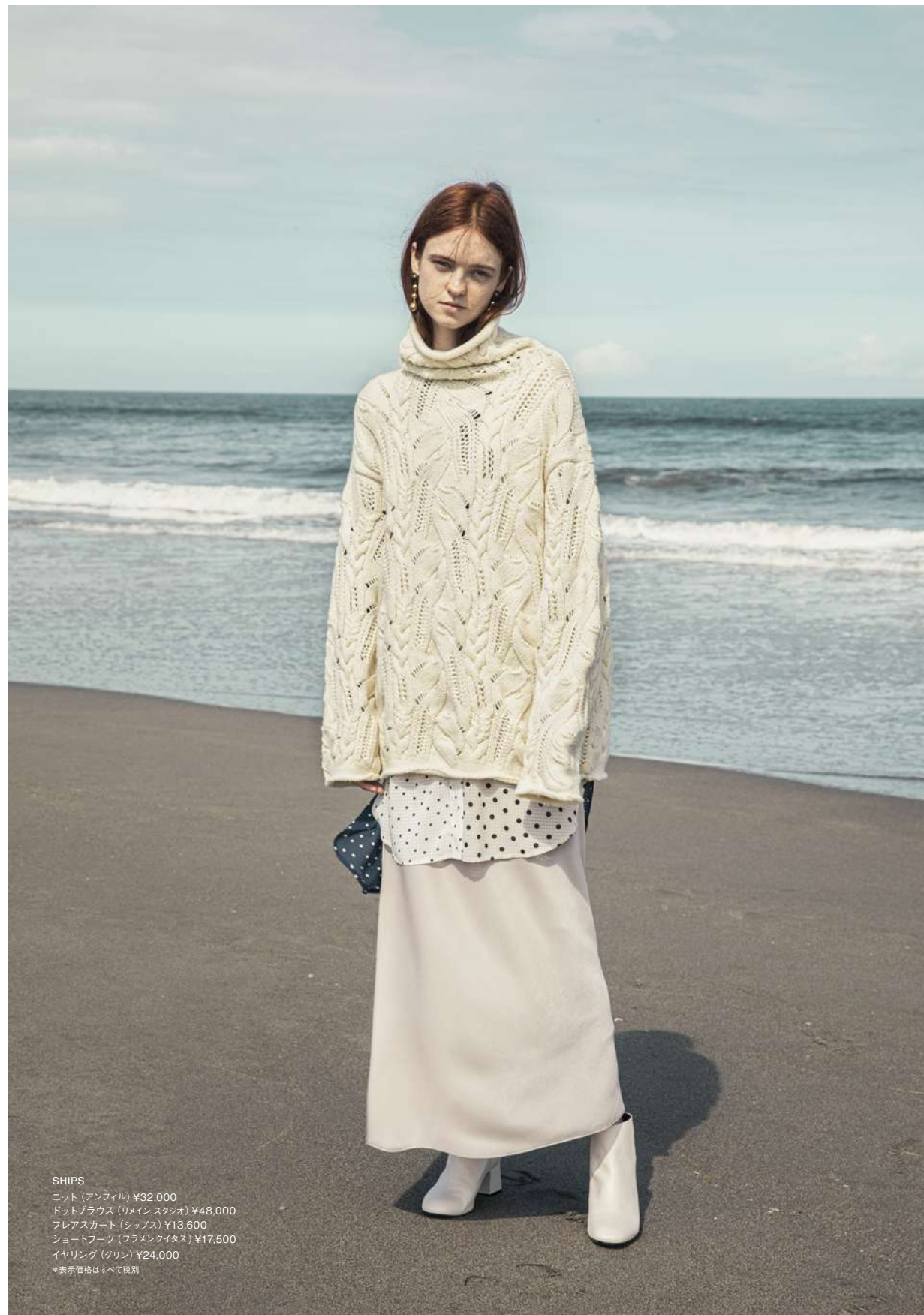
SHIPS ニット (アンフィル) ¥32,000 ドットブラウス (リメインスタジオ) ¥48,000 フレアスカート (シップス) ¥13,600 ショートブーツ (フラメンクイタス) ¥17,500 イヤリング (グリーン) ¥24,000 *表示価格はすべて税別