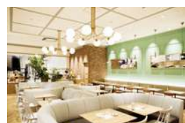
1F アフタヌーンティー・ ティールーム

グリーンと白を基調とした心やさしくカフェ。約7種から3品のスイーツとドリンクを選べる、14時から提供のアフタヌーンティーセットがおすすめ。