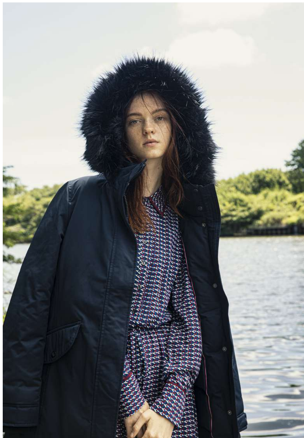
トミー ヒルフィガー パテッドコート ¥39,000 ドレス ¥25,000 (すべてトミー ヒルフィガー) 3連プレスレット (ガスビジュ-×フリース ストア) ¥13,000 *表示価格はすべて税別