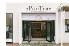
1F 湘南ヴィレッジ PanTra BY ERIC KAYSER

パリ発の人気ブーランジェリーが2019年8月に登場。テラス席で、テラスモールの食感のブリオマッシュとグラスワイン(夕方～)でブレイクを。