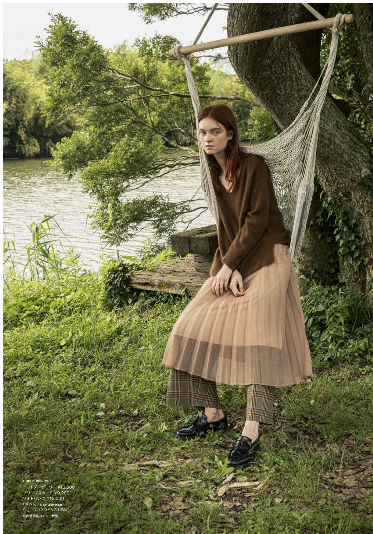
nano・universe ニットプルオーバー ¥10,000 フリーツスカード ¥9,200 ワイドパンツ ¥13,000 (すべて nano・universe) シューズ (スタイリスト私物) *表示価格はすべて税別