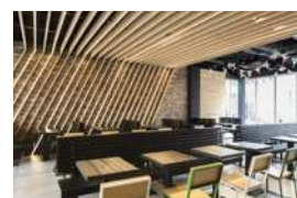
1F 2F 湘南ヴィレッジ Shake Shack

“木漏れ日”をテーマにした開放感ある2階建ての店内で、ジューシーなハンバーガーを。自由に遊べる卓球台付きルーフトップ席も要チェック。