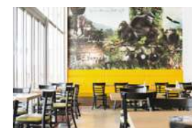
2F Urth Caffé

コーヒー豆を収穫する工程を描いた壁画が印象的な店内。種類豊富なタピオカやパンケーキ、ハンバーガーは食べ応えもあり人気が高い。