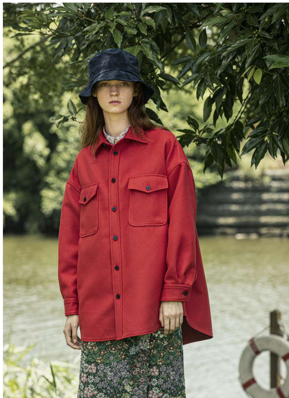
BEAMS ジャケット ¥14,800 シャツ ¥14,500 スカート ¥21,800 (すべてビームス ボーイ) ハット (ケープルアミ×ビームス ボーイ) ¥18,000 *表示価格はすべて税別