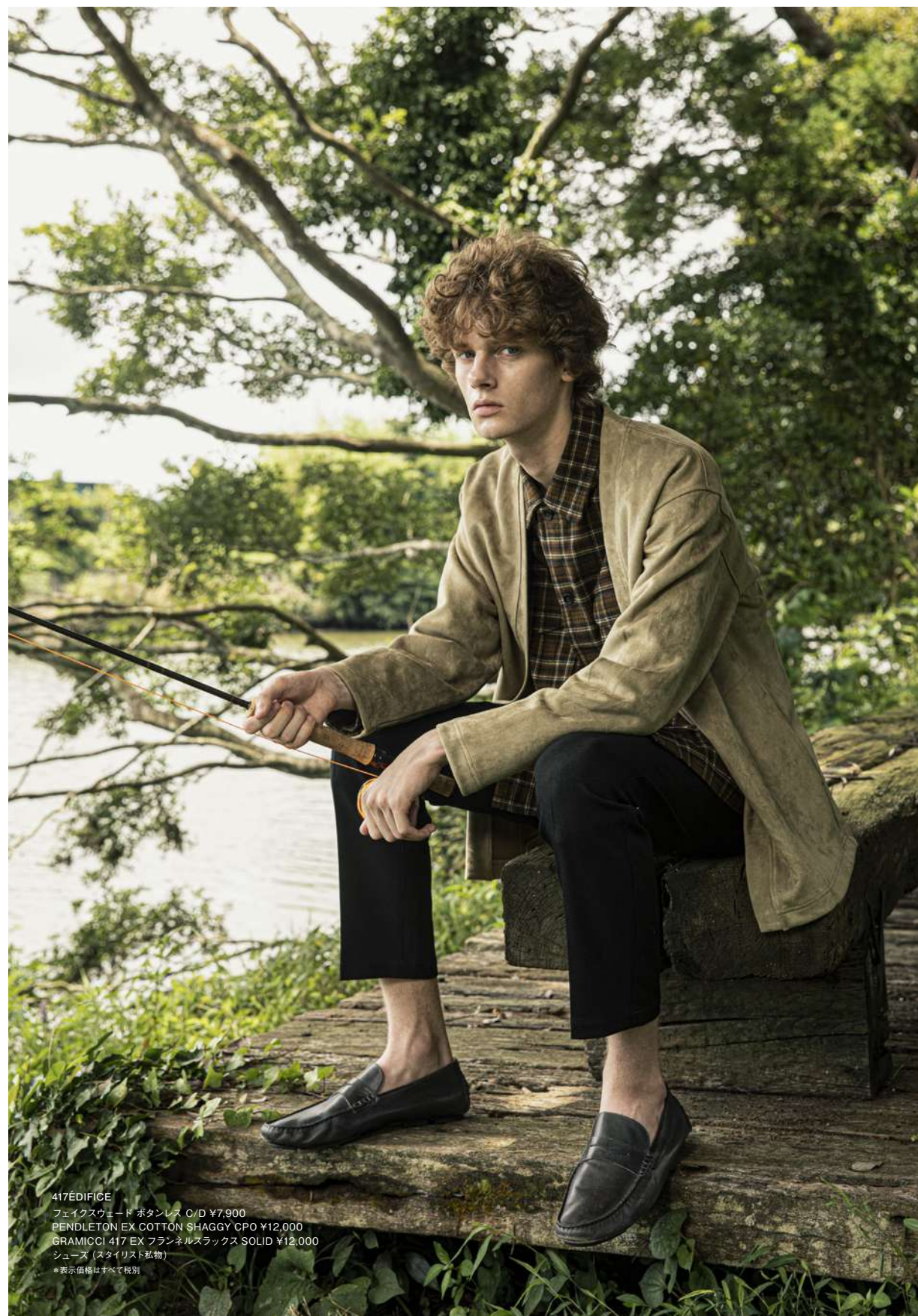
417ÉDIFICE フェイクスウェード ボタンレス C/D ¥7,900 PENDLETON EX COTTON SHAGGY CPO ¥12,000 GRAMICCI 417 EX フラネルスラックス SOLID ¥12,000 シューズ (スタイリスト私物) *表示価格はすべて税別