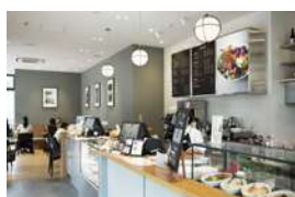
1F 湘南ヴィレッジ DEAN & DELUCA CAFE

パリスタが淹れるコーヒーや、旬の食材を使ったフードが味わえる。1面ガラス張りのテーブル席が、風を感じるテラス席でランチやカフェタイムを。